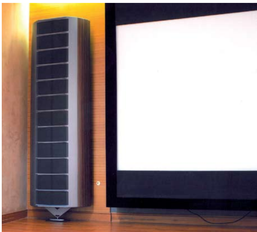
△貼牆靠角的 LS4 一樣結像玲瓏揮灑自如。