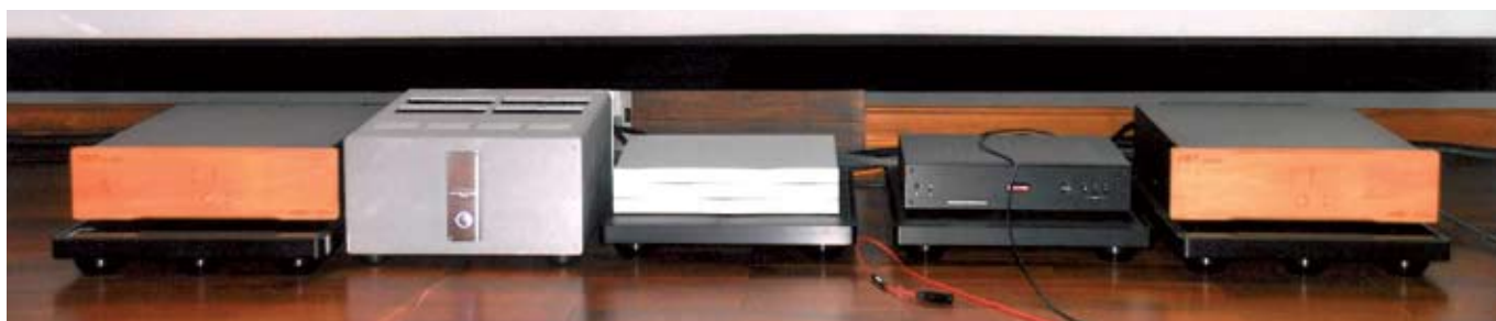
△一眾後級，左（二）Krell EVO 402。

當筆者把手上之 TIS 為“極品音響”度身造的“水晶版”試音碟播如夢《童年時》開頭幾下的金光四溢的吊鐸聲，已令在下瞠目結舌了，其金屬味之盎然，動感之鮮活，足教