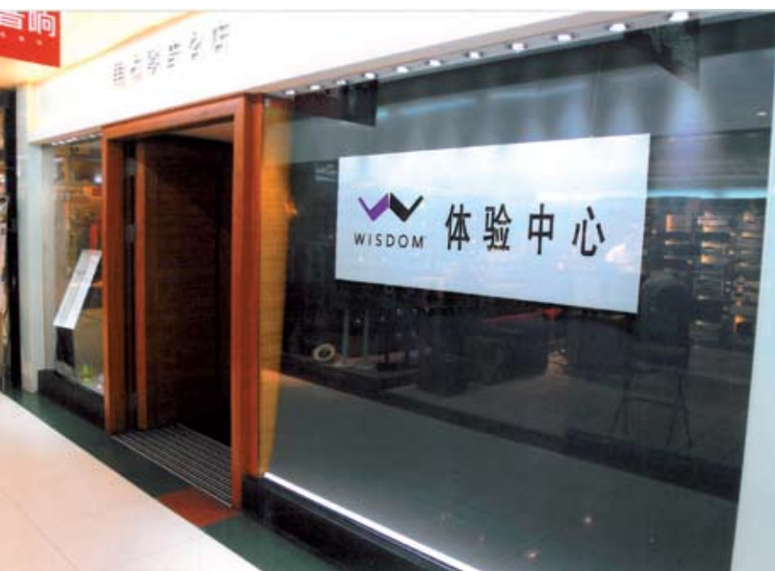
△廣州 WISDOM 體驗中心。

基於上述之內裡乾坤，我們毫不懷疑 Wisdom Audio 的喇叭具有高靈敏度，反應快，承受力大之優點，這是其一。