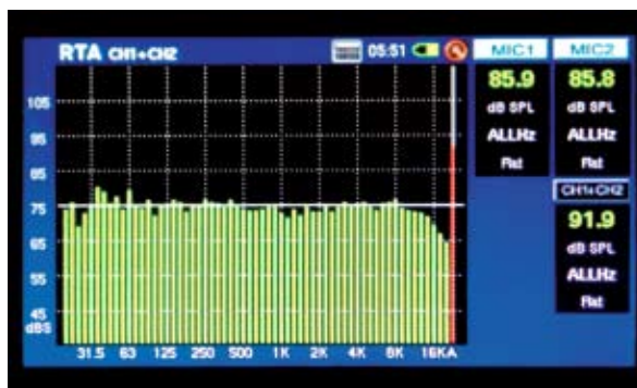
△實時頻譜分析儀在顯示 LS4 在廣州體驗中心的放音曲線。

這定價 160 萬（人民幣）一對的 LS4，它已含原廠之 SC-1 可對房間中 32 點測量的電子分頻器。