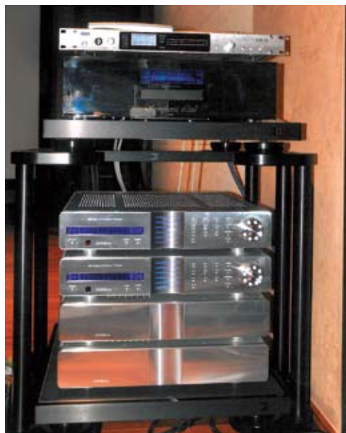
△架內 Krell EVO 2 旗艦前級，架頂德國之聲參考 CD 機。